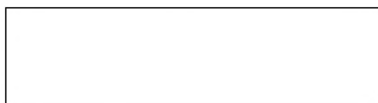
Рисунок 1 – Текст

Текст. Текст. Текст. Текст. Текст. Текст. Текст. Текст. Текст. Текст. Текст. Текст. Текст. Текст. Текст. Текст. Текст. Текст. Текст. Текст. Текст. Текст. Текст. Текст. Текст. Текст. Текст. Текст. Текст. Текст.